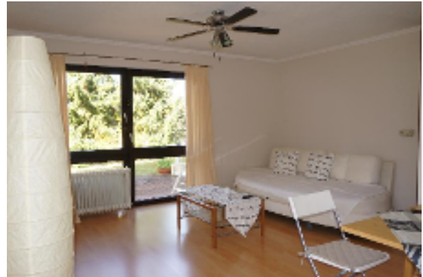
Einfach nur relaxen in modernem Ambiente