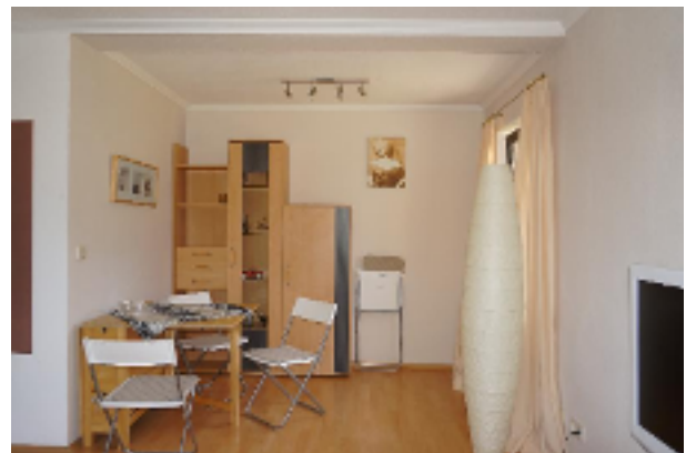
Hier können Sie sich Ihr Essen schmecken lassen