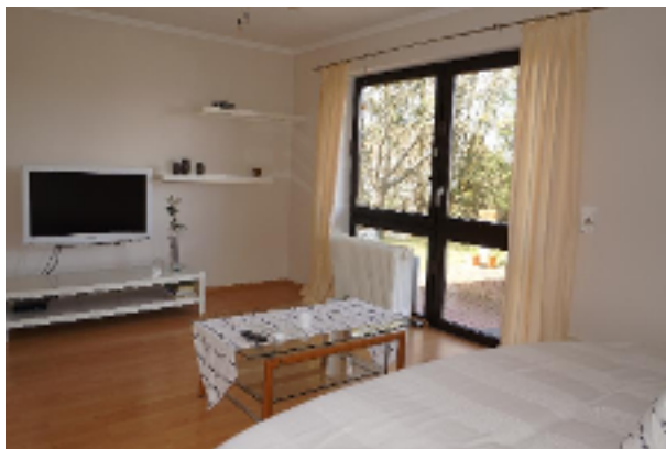
Den Feierabend und das Wochenende genießen