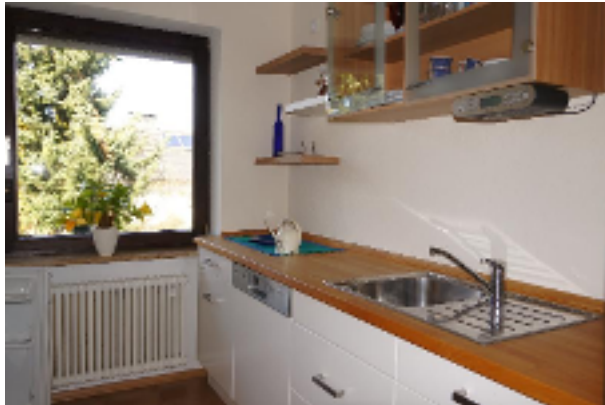
Komplett ausgestattete Küche - hier macht Kochen Spass