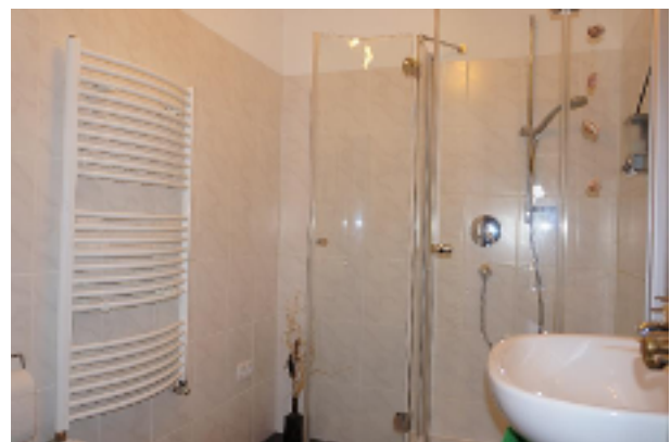
Hier können Sie sich bestens erfrischen