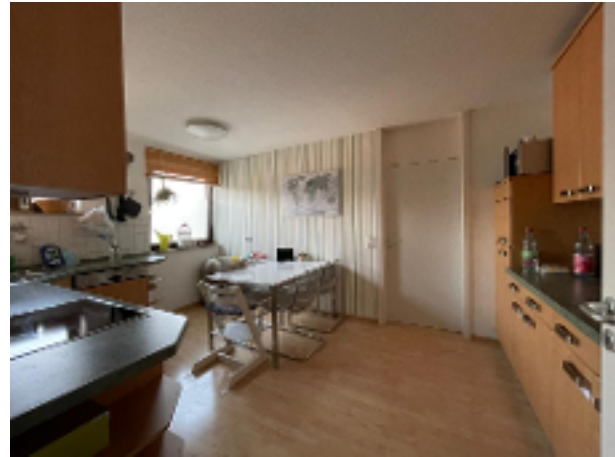
Wohnküche bietet Platz zum Essen für die Familie (Ablöse möglich!)