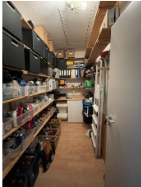
Geräumige Abstellkammer in der Wohnung