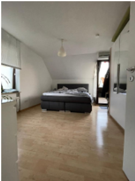
2. Schlafzimmer mit Loggiazugang