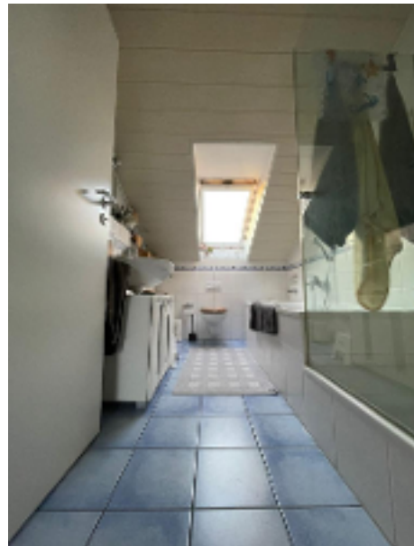
Tageslichtbad mit Wanne und Dusche