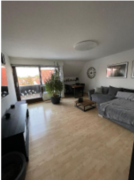
Gemütliches Wohnzimmer mit Loggia und Ausblick