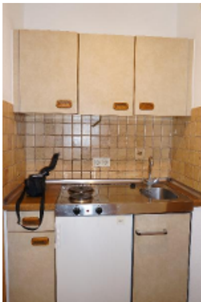
Schnell etwas Leckers kochen?