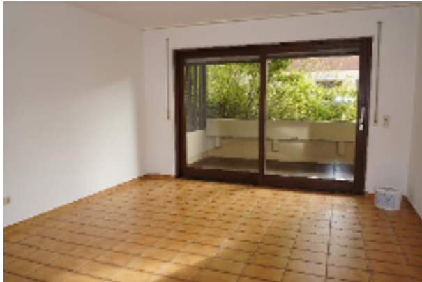
Großes Zimmer mit Fußbodenheizung und Balkonzugang