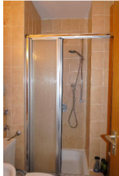
Hier können Sie sich erfrischen!