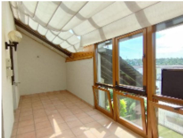
Hier können Sie geschützt den Abend auch in der kühleren Jahreszeit genießen