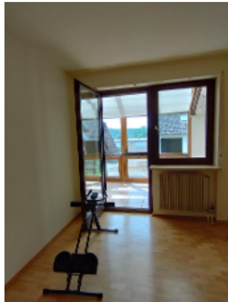
Kinder.- oder Fitnesszimmer