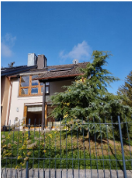
Ruhig und sonnig gelegenes Reiheneckhaus