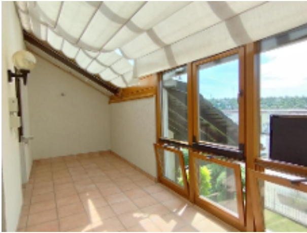
Hier können Sie geschützt den Abend auch in der kühleren Jahreszeit genießen