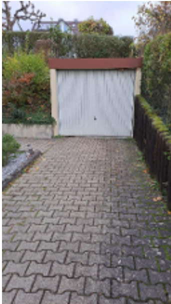
Die Einzelgarage befindet sich gleich beim Haus