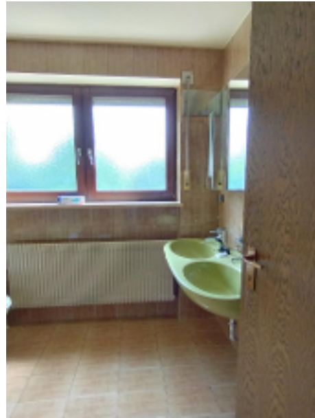
Tagesbad mit Doppelwaschbecken ...