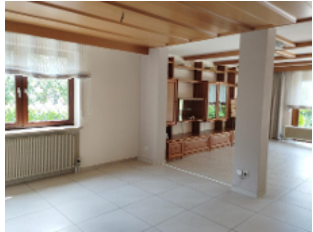
Lichtdurchfluteter Ess.- und Wohnbereich - hier lässt sich leben!