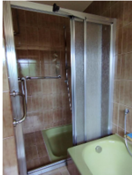
...und geräumiger Dusche, sowie Badewann zum Erfrischen und Erholen!