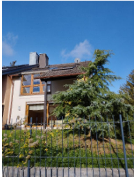
Ruhig und sonnig gelegenes Reiheneckhaus