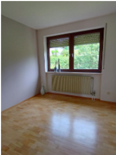
Gäste.-,Arbeits.- oder Kinderzimmer ... was Sie wollen!