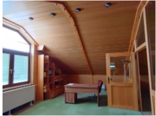
Richtig viel Platz zusätzlich unter dem Dach