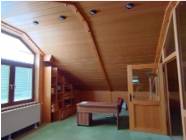
Richtig viel Platz zusätzlich unter dem Dach