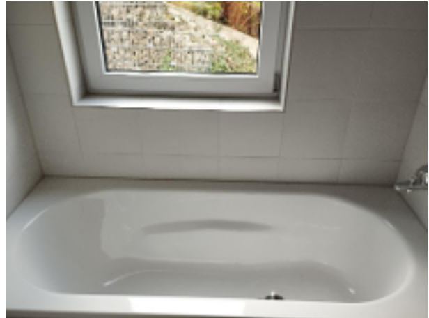
Badewanne - ALLES NEU