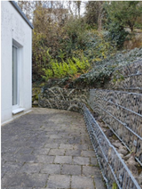
Geschützte Terrasse - ruhig relaxen