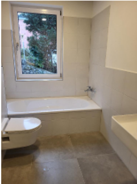
Hier können Sie sich erholen - Tageslichtbad mit Wanne