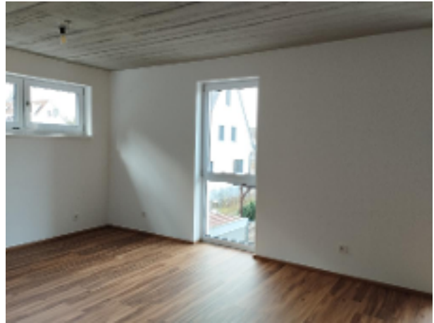
Wohnzimmer mit Abendsonne und Aussicht