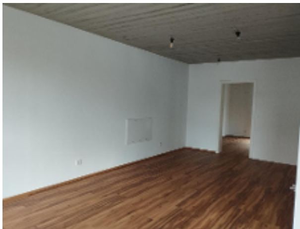
Großzügiger, offener Küchen./Essbereich