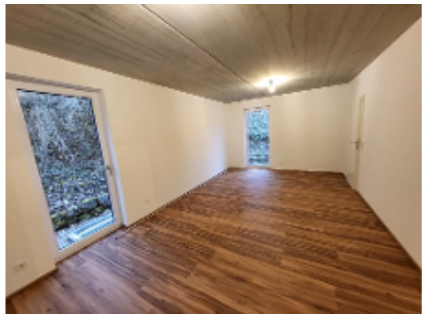
Großzügiger, besonders ruhiger Schlafraum - unterteilbar!