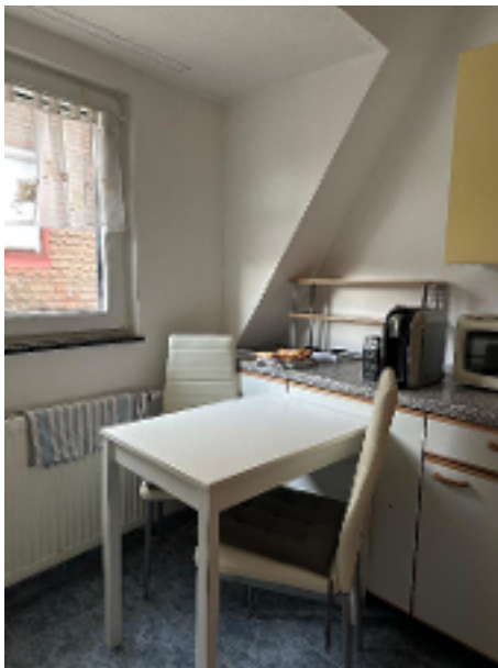
Platz für einen kl. Esstisch in der Küche