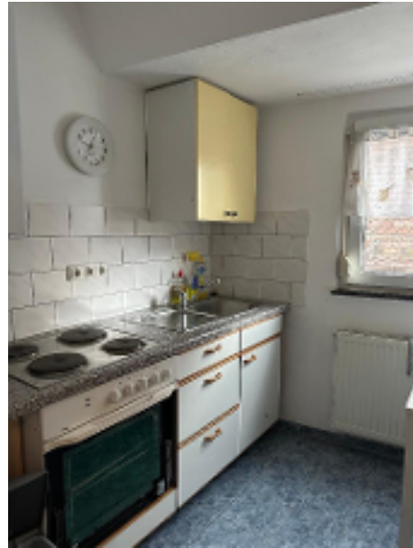
so könnten Sie Ihre Küche einrichten ...