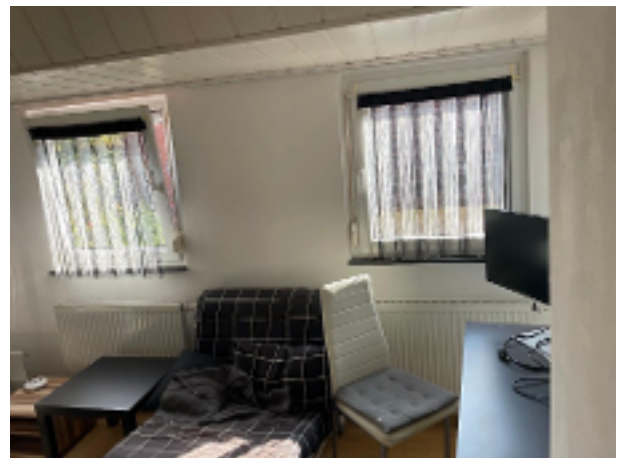
Kl. gemütliches und helles Wohnzimmer