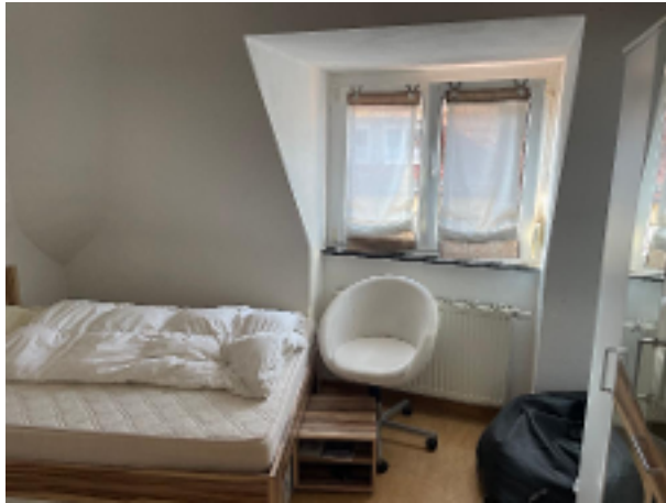
Gemütlich und ruhig unter dem Dach schlafen